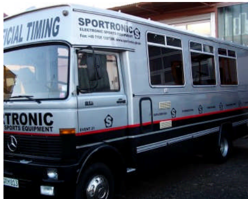
Übertragungswagen Event 21