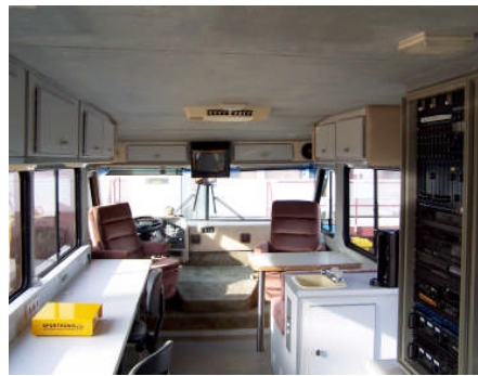
Event 11 - innen