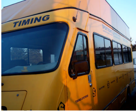
Übertragungswagen Event 11