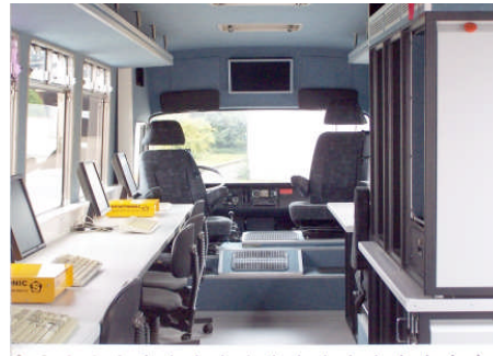
Event 21 - innen