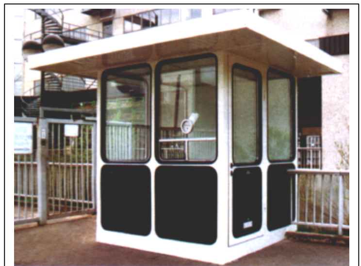
Kassenhaus KH 06 / Ticket Office KH 06 Maße / Size: 2,22 x 1,16 x 2,60 m