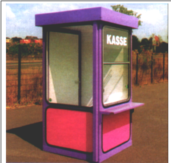
Kassenhaus KH 04 / Ticket Office KH 04 Maße / Size: 1,16 x 1,16 x 2,60 m