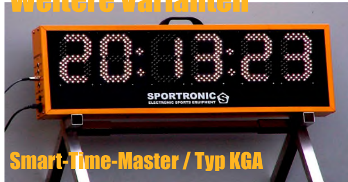
Smart-Time-Master / Typ KGA

Steuern Sie Ihre Großanzeigetafel vom Typ KGA incl. Smart-Time-Master-Erweiterung mit jedem browserfähigen Gerät, egal ob Notebook, Tablet-PC oder Smartphone.